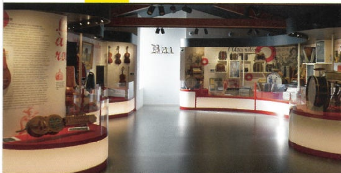
Histoire de la vielle, de l'accordéon, et du violon