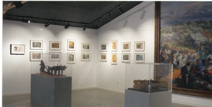
Espace d'exposition temporaire